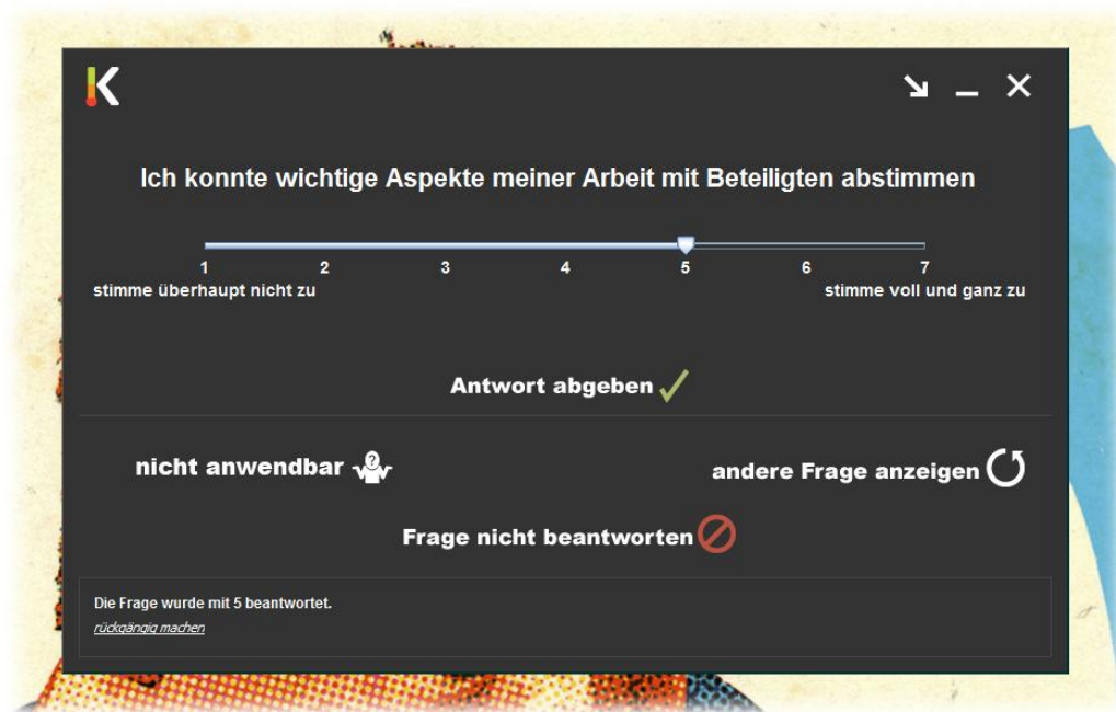
Abbildung 4 - vergrößert dargestellte Frage

In der vergrößerten Darstellung stellen sie den gewünschten Antwortwert mithilfe eines Schiebereglers ein. Ein Klick auf „Antwort abgeben“ sendet ihre Antwort an die Datenbank. Manche Fragen verfügen über einen einleitenden Text, welcher z.B. den Kontext der Frage klärt. Dieser Text erscheint, wenn sie wenige Sekunden mit dem Mauszeiger über dem Fragetext verweilen.