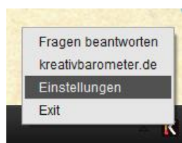
Abbildung 3 - Kontextmenü nach Rechtsklick

Alternativ haben Sie über einen Rechtsklick auf K die Möglichkeiten, die KreativBarometer Internetseite zu besuchen, das Einstellungsfenster zu öffnen oder das Programm komplett zu beenden (Abb. 3).