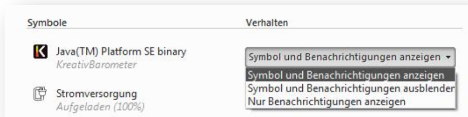
Abbildung 5 - Das KB-Logo ständig im System Tray einblenden

Insbesondere, wenn man auf das automatische Erscheinen der Fragen verzichtet, kann das Bewusstsein für das KreativBarometer durch ein ständiges Anzeigen des Logos erhöht werden. Hierfür klickt man auf den kleinen Pfeil unten rechts in der Windows Taskleiste > Anpassen... > Symbol und Benachrichtigungen anzeigen (Abb. 6).